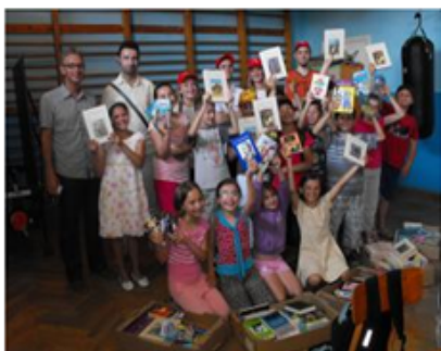
Donație de carte la școala Utvin

Donație de carte pentru biblioteca școlii din Utvin